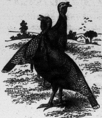
9ème prix. Un trio de