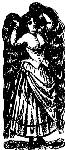
Marque de Commerce.

Pourquoi permettre à vos cheveux gris de vieillir prématurément quand, par un usage judicieux du RESTAURATEUR DE ROBSON, vous pouvez facilement rendre à votre chevelure sa couleur naturelle et faire disparaître ces signes d'une décadence précoce?