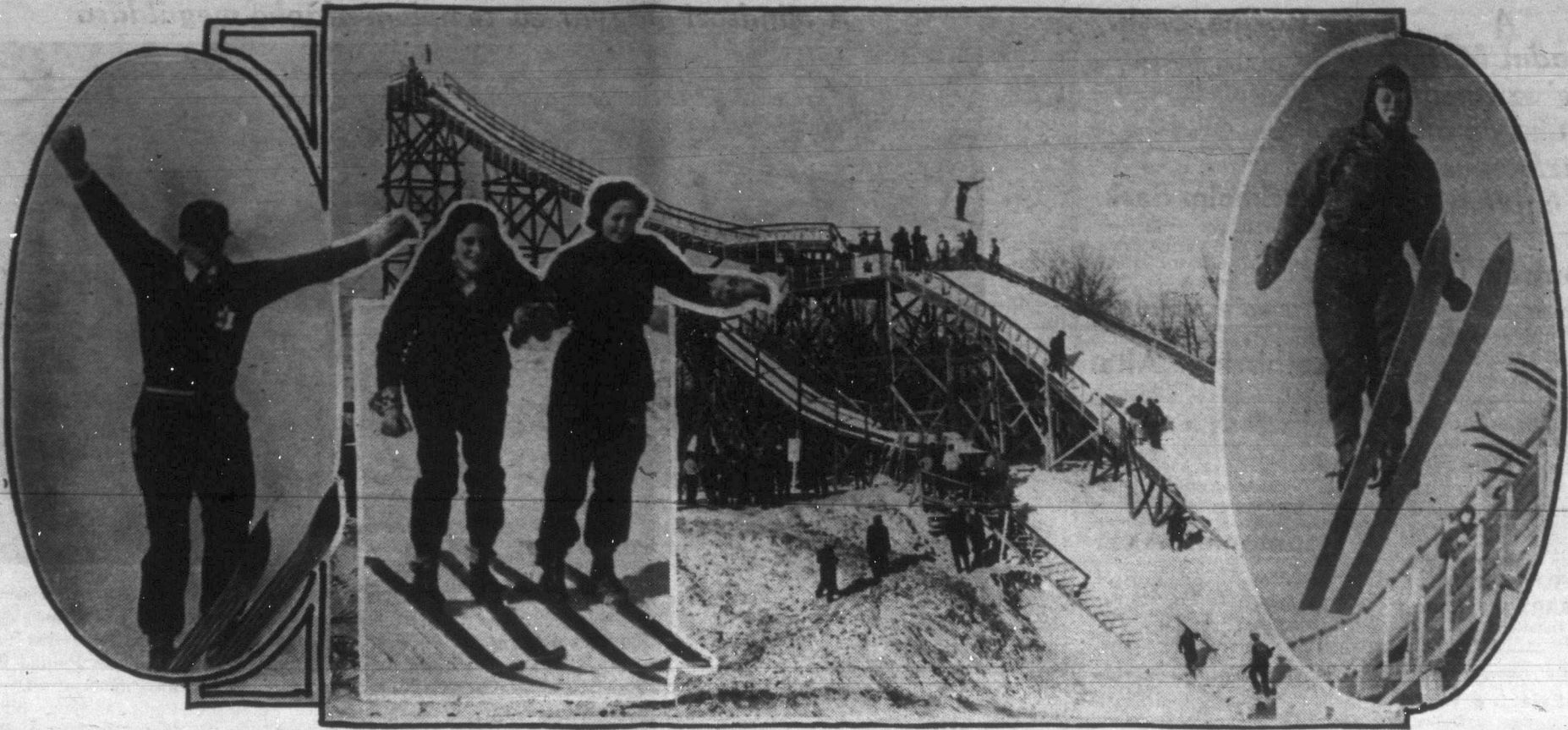
Ma már csak emlék a fenti gyönyörű kép, mely a téli sportot űző fiatalság ügyeskedését mutatja be. — Az időjárást jelző jelentések szerint egész Kanadában diadalmas napsütéssel — egyes helyeken valóságos kánikulával fűszerezve — békésen tört a tavasz.