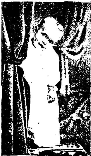
—Santa-Claus va-t-il venir ?