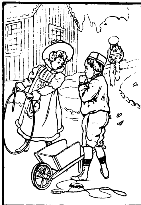
Acte II.—Scène de jalousie