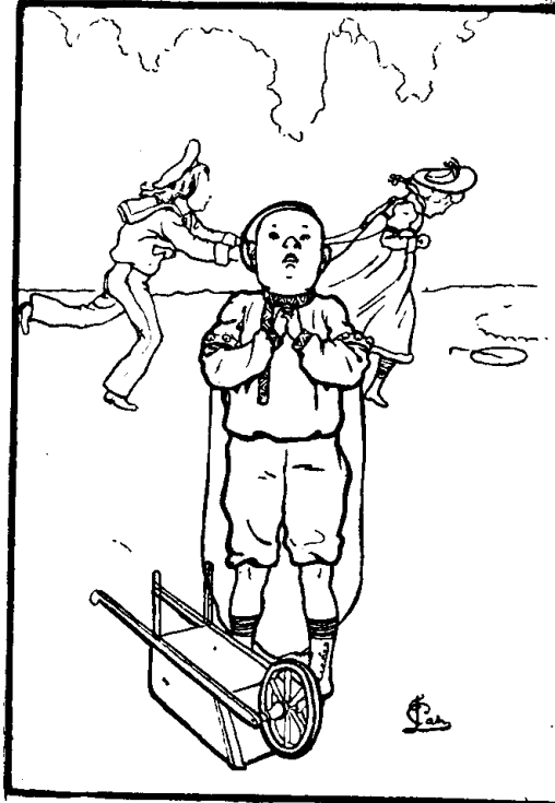
Acte IV.—“ Ah ! les femmes ! ”