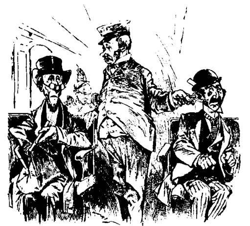
IL OUBLIA DE REGARDER EN POIÇONNANT

Conducteur (à un passager lent).—Pourquoi ne mettez-vous pas votre ticket sur votre chapeau, comme le fait ce monsieur ? Je n'aurais pas besoin d'attendre des minutes après vous !—Judge.