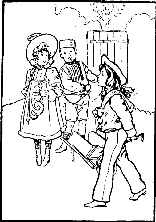
Acte I.—La rencontre