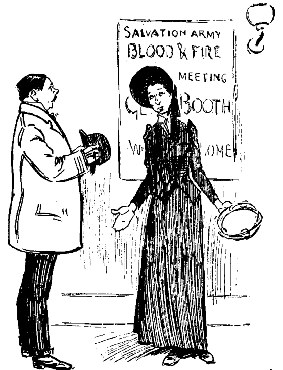
L'ARMÉE DU SALUT

A la sortie d'une séance de l'Armée du Salut, une Adepte demande à un jeune homme qu'elle a vu écouter avec beaucoup d'attention : — Etes-vous sauvé ? Le jeune homme.— Non, je suis reporter ! L'Adepte.— Oh ! je vous demande pardon !