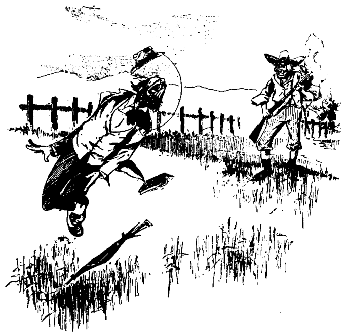
SOLILOQUE INTERROMPU Le poète de la ville.—Comme le printemps est beau, comme la nature est solennelle alors... Une voix (au loin). Ote toé de d'dans mon champ ou j'l'envoye une autre charge de sel.—(Judge).