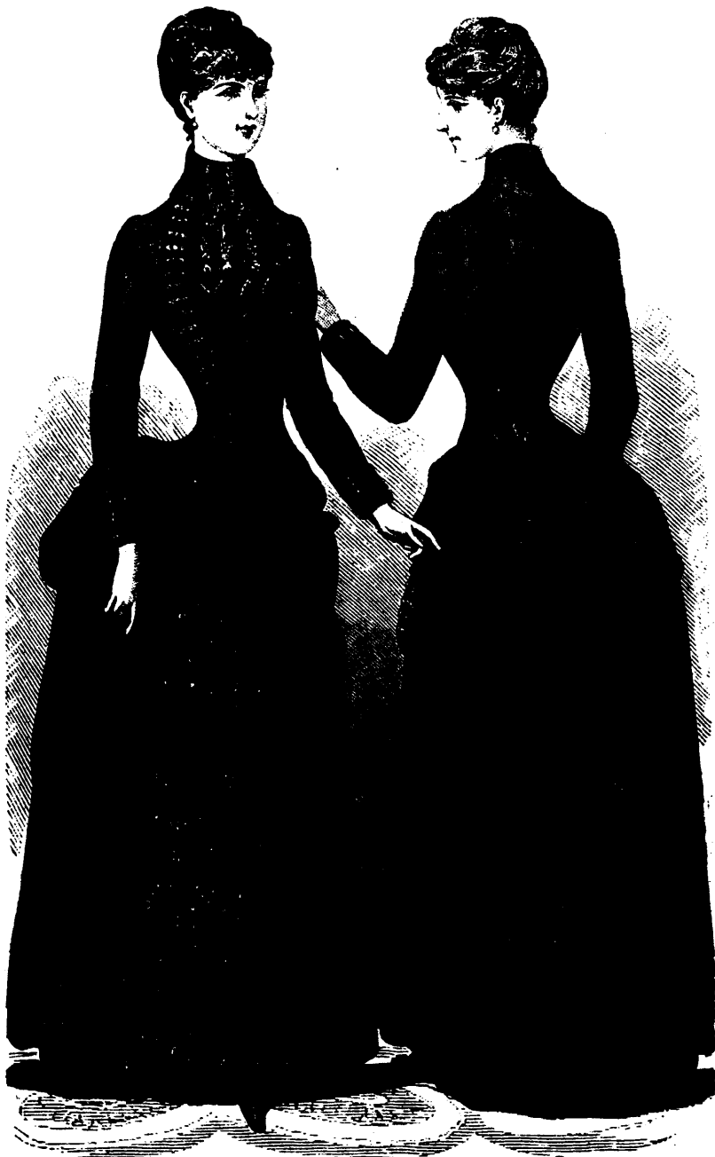
MODE. — TOILETTE DE FAILLE (DEVANT ET DOS)