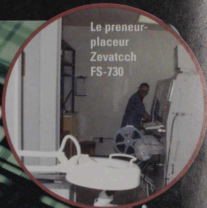
Le preneur- placeur Zevatech FS-730