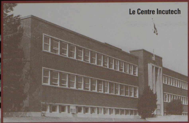
Le Centre Incutech