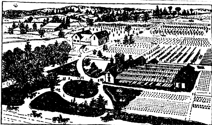
Une partie des pépinières de Fonhill.