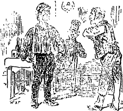
L'ESTAMINET DU TROU

deux tables en tôle jointurée et une demi-douzaine de chaises.