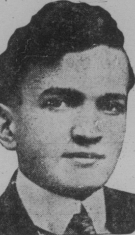
מערב קאנאדער "יאנג דזשודעא" קאנפערענץ

מאסקאו, יאנואר 6 (אי.א.) — די יעדן פון די ליטוואקאזן זוכט צו פארמאכן דאס מויל זיינע קריטיקער. די יעדן פון די ליטוואקאזן זוכט צו פארמאכן דאס מויל זיינע קריטיקער.