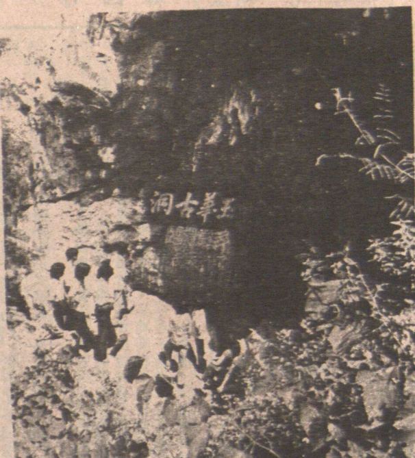
山階天南城縣樂將於位，洞華玉的建福。之洞異界奇脈山美武是，貌地溶岩屬，下。口洞洞華玉為圖。