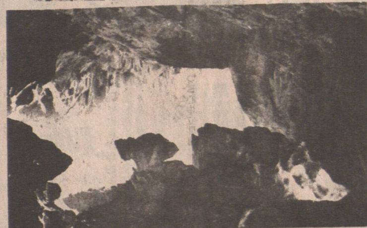
福建新的旅遊區——泰寧金湖。玉華洞勝景之一：五更天。