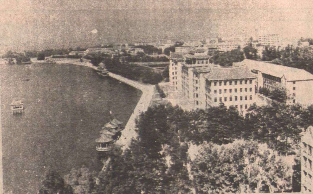
角一村學美集門廈