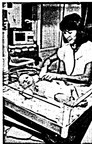
Incubateur pour nourrissons

Nourrissons. Le nouveau type d'incubateur mis sur le marché n'enferme plus complètement le nourrisson; il est composé d'un contenant en plastique ouvert au-dessus duquel, à quelques pieds, est installé un dispositif de chauffage informatisé qui garde l'air à une température constante.