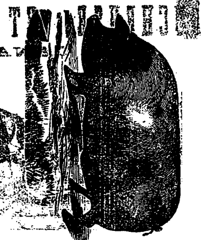
CHESTER WHITE HOG.

Des SOUSSIONS seront reçues jusqu'à MERCREDI , quinzième jour de JULIEN prochain, au Presbytère de la Paroisse de St. Damase, pour la construction d'un Presbytère et répara- tions à l'Eglise. Pour les conditions, Plans et Description s'ad- dresser au soussigné. Les syndics ne s'obligent pas à accepter la plus basse ou aucune des soumissions. N. GAUTHIER, P re Curé St. Damase, 19 mai 1870. — 3f 250.