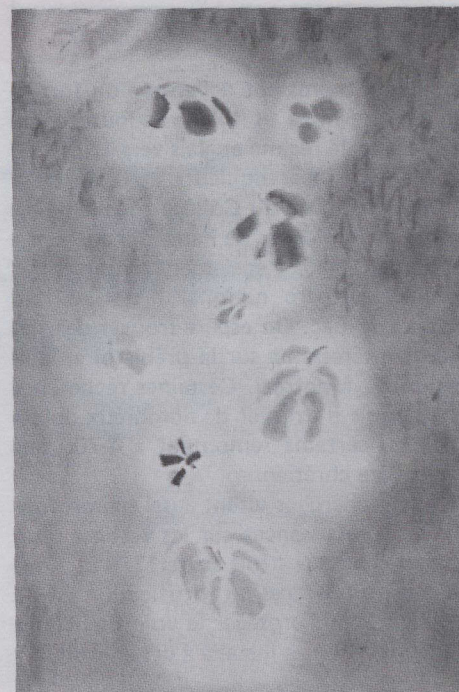
Vicenza, K.M. Graham, 1979, acrylique sur toile.

des peintures voulues, exécutées, dirigées par l'artiste. Les toiles de Bolduc sont des méditations sur l'art proprement dit. Les oeuvres plus récentes de Fournier sont lourdes d'allusions cosmiques. Quant aux images de Graham, elles dérivent de ses observations et de son profond sentiment de la nature et de la vie dans le Grand Nord."