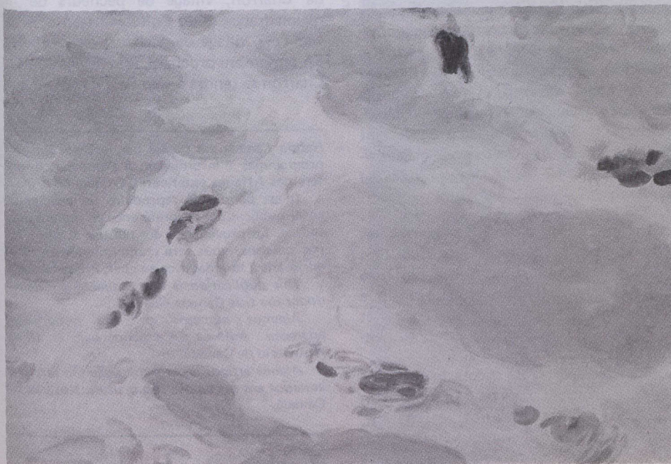
Azure Drift, Paul Fournier, 1979, acrylique sur toile.