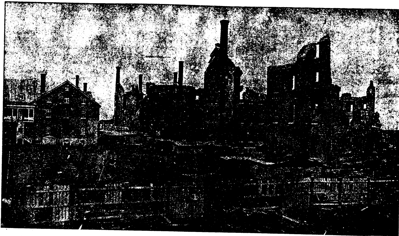
VUE PRISE DU COTÉ NORD MONTRANT LA BUANDERIE

La ligne, par insertion - - - - - 10 cents insertions subséquentes - - - - - 5 cents Tarif spécial pour annonces à long terme