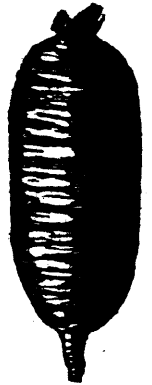
40. RADIS NOIR D'HIVER.

TETRAGONE, ou Epinard de la Nouvelle-Zélande..... par paquet 0.10 Culture. —La graine peut être semée en pleine terre d'Avril à Juillet dans une terre riche humide et très meuble. Faites les rangs profonds d'un pouce et demi et espacés de trois pieds. Semez très clair de manière à n'avoir qu'une plante par pied de terrain. Si la saison était sèche il faudrait arroser. Ils poussent avec vigueur et dans une bonne terre ils s'étendront à trois pieds dans chaque direction avant la fin de la saison.