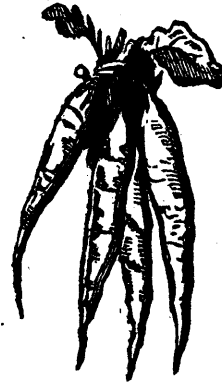
39. RAVE VIOLETTE.

pendre trois ou quatre rangées au dessus les unes des autres. Le tabac devrait être suspendu de telle manière à ce que les plants soient séparés les uns des autres.