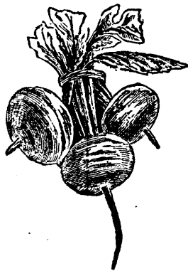
38. RADIS BLANC.

RHUBARBE. Victoria et autres espèces..... par paquet 0.10 Culture. —Semez de bonne heure au printemps, en rangs espacés d'un pied, éclaircissez les plants à neuf pouces de distance, quand ils auront atteint quelques pouces de hauteur. Au printemps suivant transplantez en rangs espacés de trois pieds en tous sens. Comme certaines espèces sont bien plus grosses que d'autres, il faudra régler les espaces en conséquence. Que le sol soit très riche, meuble et net.